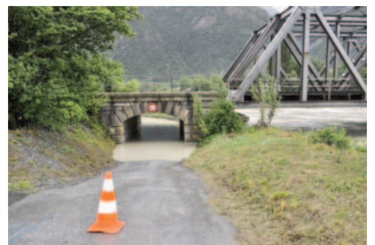
Les violents orages de lundi ont aussi créé quelques soucis dans le Valais central à proximité du lit du Rhône à Chamoson-Riddes. MASOTTI

Le temps de ces dernières semaines est rythmé par des journées caniculaires, des nuits tropicales et des orages violents. Un scénario qui pourrait se répéter durant les prochains jours. A la clé, des cours d'eau en crue, des laves torrentielles, des gravats sur les routes ou des caves inondées. D'aucuns y décèlent déjà les méfaits du réchauffement climatique. Daniel Masotti y voit une conjonction de causes dont une que l'on a peu évoquée. Savez-vous que l'année 2013 coïncide avec une intense activité solaire accompagnée d'une augmentation de rayonnements en tous genres? Le météorologue chamosard qui dispose d'un bureau conseil rappelle que «2013 figure dans les maximums d'éruptions solaires portant sur un cycle de 12 ans environ. Qui dit maximum solaire dit forte chaleur avec convections nuageuses des plus ravageuses. Et davantage d'orages violents.» Depuis le 1er cycle découvert en 1761, nous en sommes à la 24e période qui a débuté en 2008 et dont le maximum est prévu cette année.